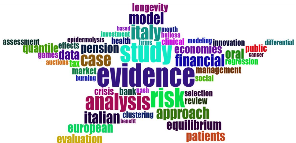
Wordcloud del DISES (termini estratti dai titoli dei lavori)

Relazione concernente i risultati delle attività di ricerca nel 2022