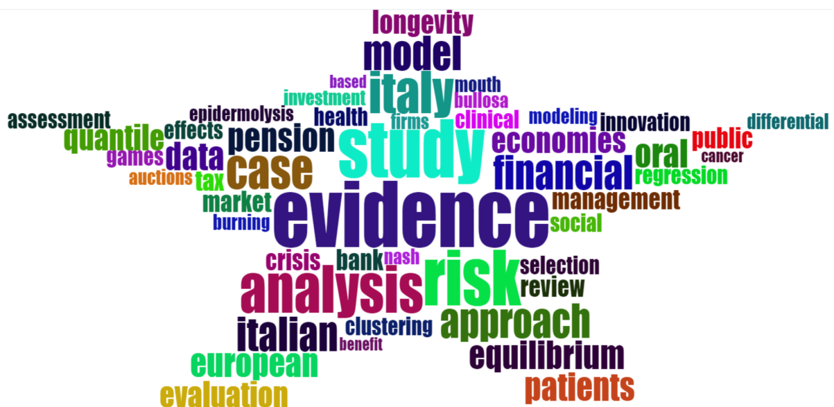
Wordcloud del DISES (termini estratti dai titoli dei lavori)

Relazione concernente i risultati delle attività di ricerca nel 2021