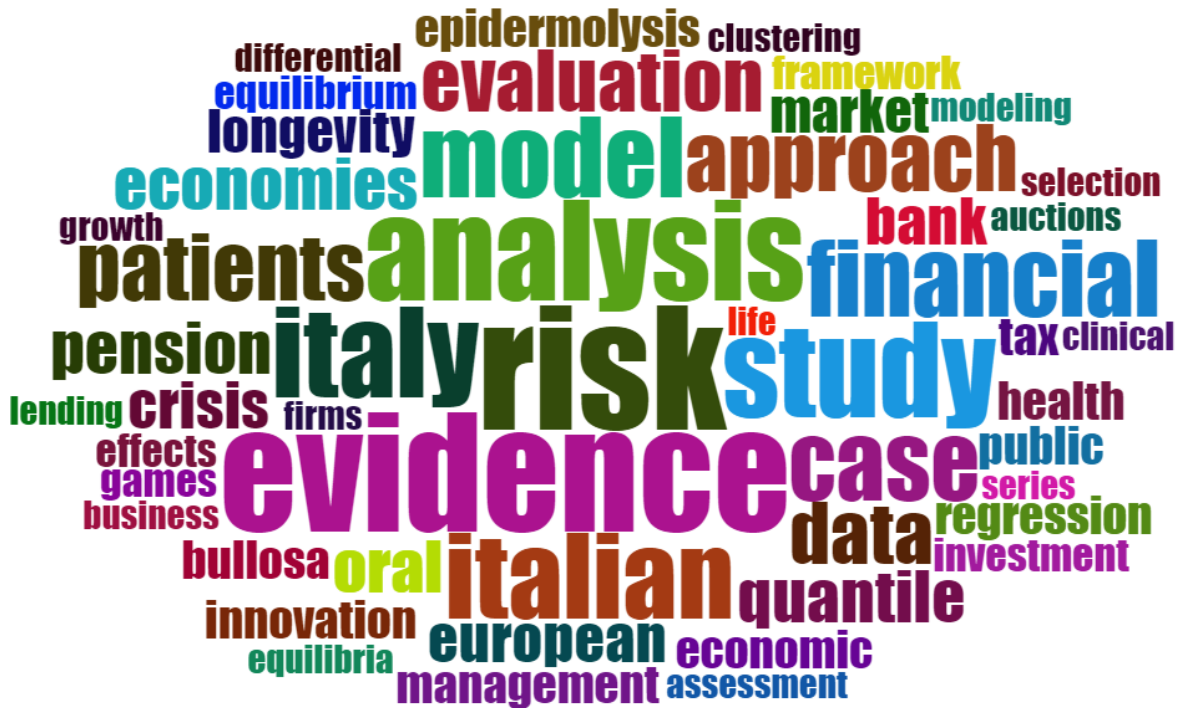
Wordcloud del DISES (termini estratti dai titoli dei lavori)

Complesso Universitario di Monte Sant'Angelo Via Cintia, 21 80126 Napoli Tel: +39 081 675013 Fax +39 081 675014 pagina web: www.dises.unina.it