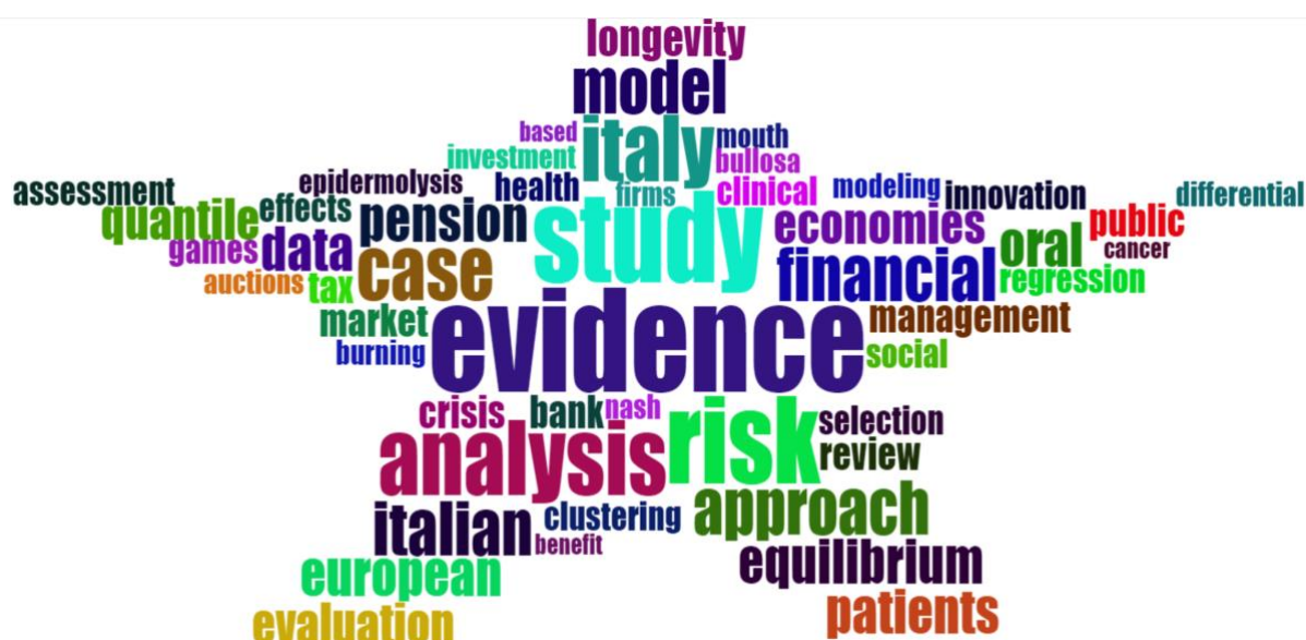
Wordcloud del DISES (termini estratti dai titoli dei lavori)

Relazione concernente i risultati delle attività di ricerca nel 2020